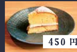
ヴィクトリアケーキ