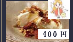
こぼれ梅のグラノーラ バニラアイス [ハーフ] 280円