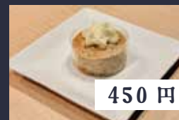
アールグレイの チーズケーキ