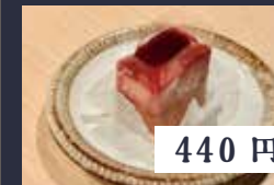
フランボワーズと チョコのケーキ