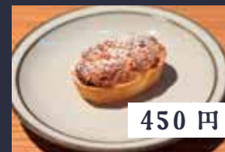
バナナとココナッツ のタルト